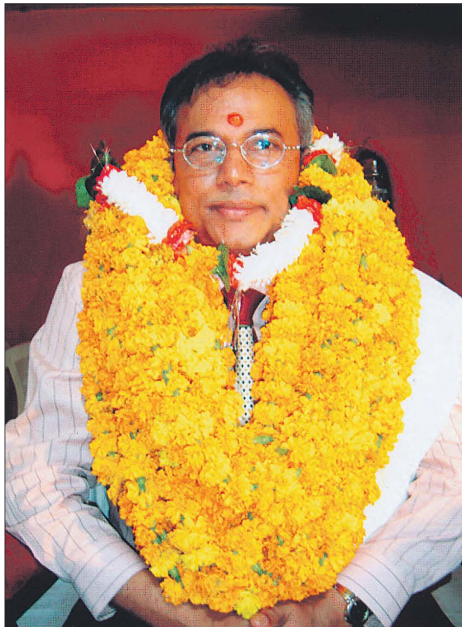
De Indiase bloemenhulde voor de afgestudeerde Misier.

Het oude verhaal van de Indiase diaspora is er één van strijd, ondernemingsgeest en